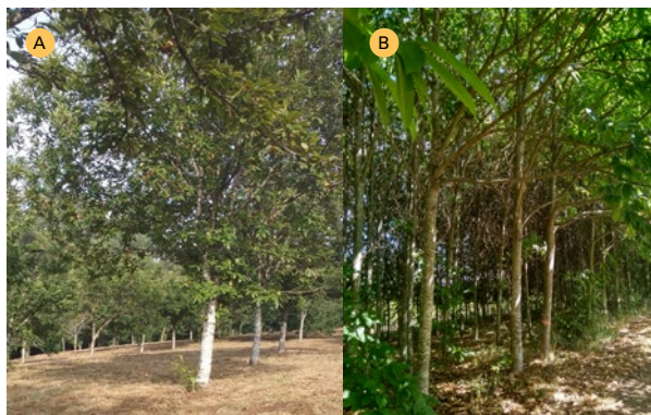
Figura 5. Fotografías das parcelas de Sergude (A) (1997) coa colección de xermoplasma de variedades tradicionais galegas e Mantequera (B) (2007) coa colección de híbridos entre os que se atopan os MFR.

xermoplasma de variedades da parcela de Sergude contén unha ampla representación das variedades de froito galegas, non soamente as que están actualmente incluídas no Rexistro de Variedades Comerciais, e todas elas poden ser de grande interese no futuro; ademais, o nivel de infestación observado en condicións controladas das variedades foi relativamente baixo (arredor do 35%) no primeiro ano de infestación en condicións controladas mentres que en campo a infestación media das árbores neste ano foi dun 54%. Na parcela de Sergude medíronse en cada árbore as mesmas variables que nas cabinas do insectario e, ademais, tamén se tomaron mostras representativas de cada árbore para medir o tamaño medio das bugallas.