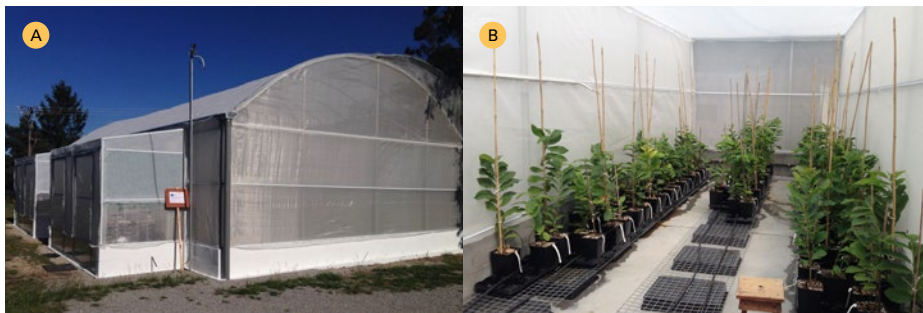
Figura 2. Insectario do CIF-Lourizán e colocación de plantas dunha das cabinas de experimentación no 2015.

No CIF-Lourizán instalouse no ano 2015 un insectario-vernadoiro para poder traballar con pragas e avaliar a tolerancia de distintos materiais vexetais (Figura 2). Entre os anos 2015 e 2017 fóronse incluíndo materiais das tres coleccións (híbridos MFR, variedades tradicionais e novos híbridos de polinización controlada), someténdose a un elevado grao de ataque mediante infestación obrigada e non obrigada con adultos de avespas.