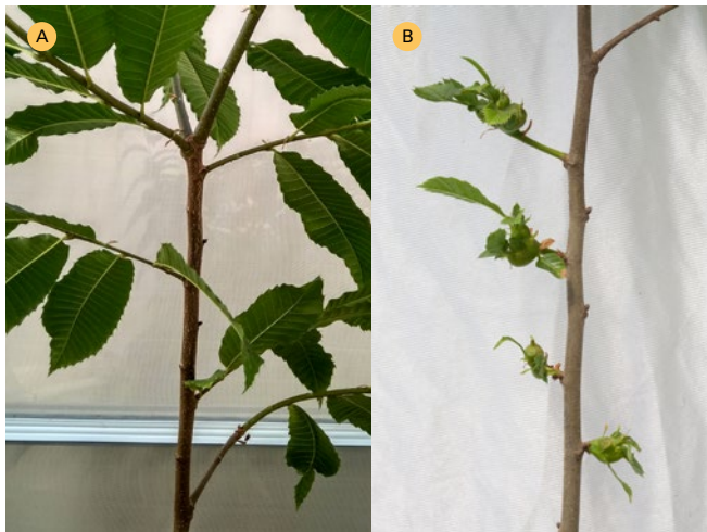
Figura 6. Exemplos dun híbrido resistente (90044) e outro sensible (7521) tras un ciclo de infestación obrigada.

As avaliacións e análises estatísticas dos ensaios en condicións controladas mostran que existen clons híbridos MFR resistentes ao ataque da avésa do castiñeiro, é dicir, ningunha das súas réplicas amosaron síntomas de infestación. Algúns destes clons son moi empregados en plantacións como os clons 90044, 125 e 392, que son tamén clons ben valorados como portaenxertos pola súa compatibilidade ao enxerto e resistencia á tinta. No entanto, outros clons tamén coñecidos polo sector e ben valorados como portaenxertos como o 2671, 1483, 7810, 7521 ou 111 mostran unha considerable sensibilidade ao ataque da avésa aínda que con diferentes graos de tolerancia (Táboa 1). Os niveis de tolerancia establécense mediante unha combinación dos resultados obtidos para as tres variables avaliadas (Táboa 1) na que a porcentaxe de infestación das plantas é considerada a característica principal, a cal oscila entre o 5 e o 75% nas cabinas de híbridos MFR. Na Figura 6 móstranse dous exemplos de híbridos correspondentes a diferentes categorías de tolerancia, un resistente (90044, Figura 6A) e outro de tolerancia baixa (7521, Figura 6B).