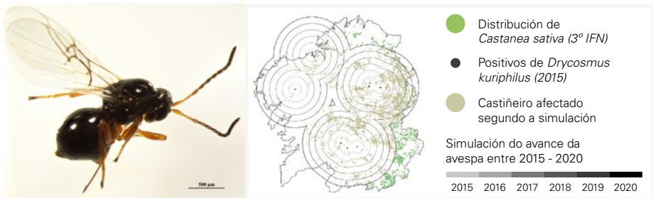
Figura 1. Previsión feita en 2015 da dispersión da avespa do castiñeiro entre os anos 2015 e 2020 a partir das localidades onde se detectou por primeira vez en maio do 2014.

A avespa do castiñeiro Dryocosmus kuriphilus , procedente da China, é considerada a principal praga do castiñeiro europeo ( Castanea sativa ). Maníffestase na primavera coa formación de bugallas en diferentes partes dos novos gromos, de onde emerxen os adultos nos meses de xullo e agosto para levar a cabo a oviposición nas novas xemas e completar o seu ciclo na seguinte primavera. As principais consecuencias desta praga son a redución da superficie foliar fotosintética e o impedimento do desenvolvemento dos gromos, de modo que as árbores se debilitan e poden acadarse perdas de entre o 50 e o 100 % na produción do froito. En Galicia foi detectada por primeira vez no ano 2014 en oito localidades das provincias de Lugo, A Coruña e Ourense, e a súa expansión superou de sobra as expectativas estimadas (Figura 1), estando presente na actualidade en practicamente todo o territorio da comunidade.