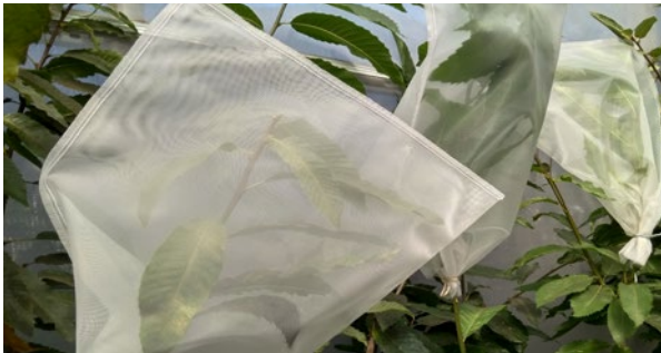
Figura 3. Plantas cubertas con mallas antiinsectos para o experimento de infestación obrigada.

En 2017 estableceuse un novo ensaio con 24 variedades tradicionais enxertadas o ano anterior cun número medio de catro réplicas por clon. Estas variedades correspóndense na súa maioría coas variedades incluídas no Rexistro de Variedades Comerciais (RVC). Incluíronse tamén neste ensaio outros 20 clons MFR con 6 réplicas por clon. Todo este material someteuse a unha infestación obrigada (Figura 3), é dicir, á colocación dunha malla por cada planta e á liberación das avéspas dentro das mallas, cunha relación dunha avésa por cada tres xemas. Este tipo de infestación foi máis exitosa que a non obrigada que se levou a cabo en 2015, posto que nun ano se acadou un nivel de infestación do 47% dos gromos nos híbridos MFR sensibles e un 35% nas variedades tradicionais.