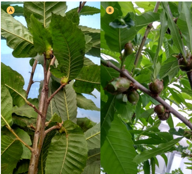
Figura 7. Exemplos das variedades 'Puga do Bolo' (A) e 'De Parede' (B) tras un ano de infestación obrigada.

As 23 variedades do RVC que tanto en condicións controladas coma na parcela de Sergude amosan un maior nivel de tolerancia son 'Rapada', 'Branca', 'Negral', 'Rapada do Sil' e 'Amarela', aínda que, como se observa na táboa, dentro desta categoría de tolerancia, 'Rapada' e 'Branca' presentaron os mellores valores nas características avaliadas e 'Negral' foi a variedade cunha menor porcentaxe de gromos anulados pola presenza de bugallas. Tamén 'Longal' presentou unha tolerancia elevada con respecto ás 47 variedades avaliadas na parcela de Sergude. As variedades con maior sensibilidade ao ataque da avespa foron 'Inxerta', 'Loura', 'Ventura', 'Calva', 'De Presa' e 'De Parede', resultados que foron tamén congruentes cos niveis de infestación obtidos en condicións controladas. Na Figura 7 móstranse dúas variedades, 'Puga do Bolo' e 'De Parede', con diferentes graos de infestación e claramente diferenciábeis no tamaño das súas bugallas.