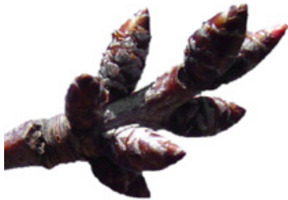
Imaxe 10: Xema vexetativa de cerdeira con forma cónica.

Na cerdeira silvestre os froitos (Imaxe 13) e, polo tanto, os ósos (Imaxe 14) son moito máis pequenos que nas variedades enxertadas; a cor vai dende vermella escura ata clara; a polpa dende vermella a amarela. Desenvólvense en feixes e a maduración pode acontecer de xeito desigual dentro dun feixe, formado normalmente por dous froitos. Os froitos comezan a madurar dende finais de maio nas árbores situadas en clima atlántico, ata finais de xullo nas árbores que se atopan nas montañas orientais galegas. O sabor dos froitos da cerdeira silvestre varía coas árbores, podendo ser máis ou menos doce ou máis ou menos amargo.