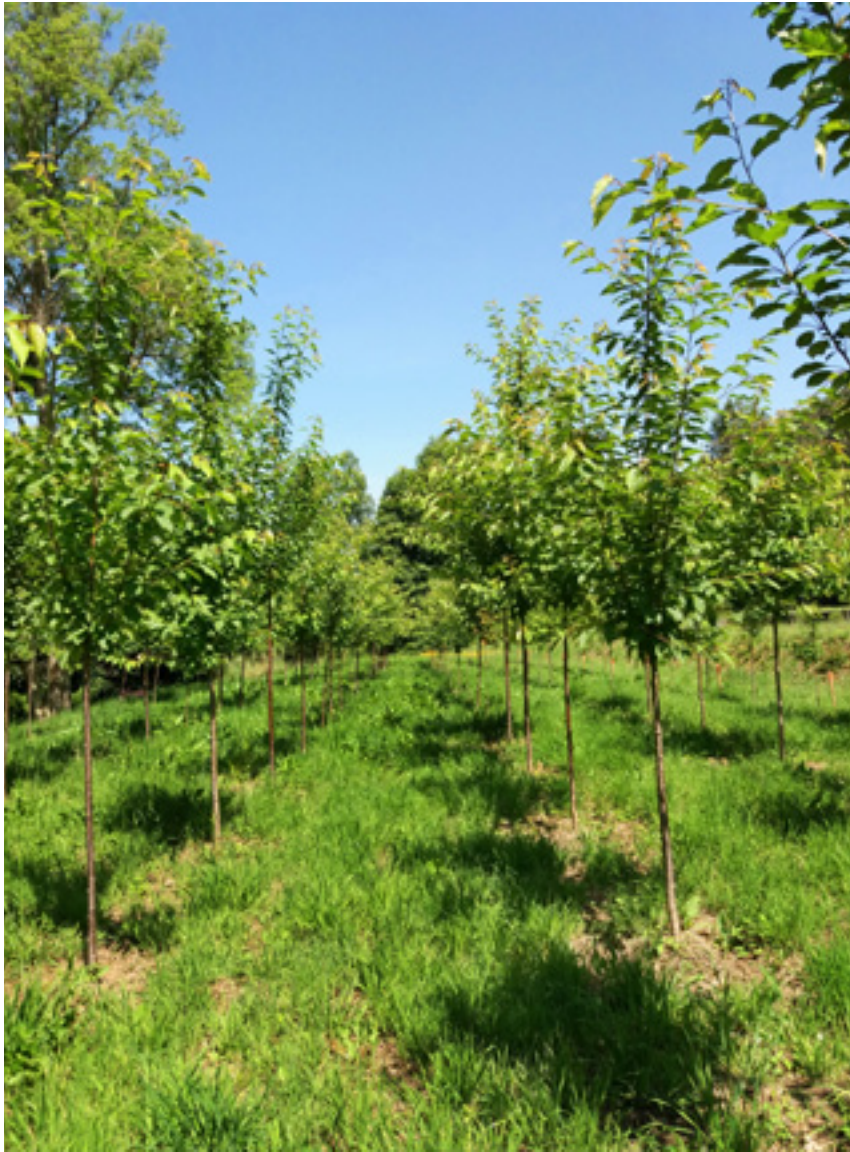
Imaxe 23: Plantación experimental de clons de cerdeira para comparar diferentes clons e avaliar a adaptación e supervivencia ao lugar de plantación, o crecemento e a forma das árbores.