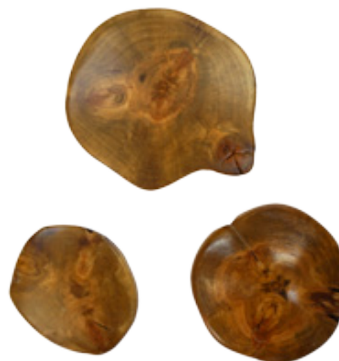
Imaxe 60: Nós no corte transversal do tronco.