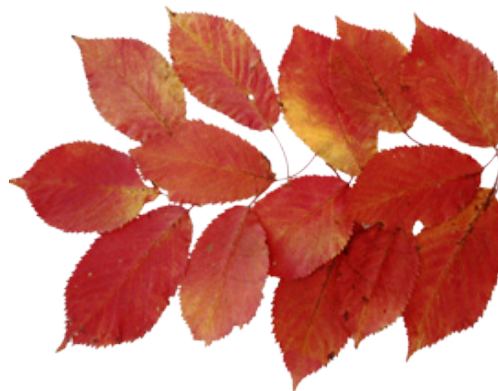
Imaxe 44: Follas vermellas no outono dun clon de cerdeira.