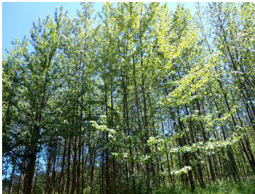
Imaxe 22: Aspecto xeral dunha plantación de cerdeira de 16 anos no Centro de Investigación Forestal de Lourizán.