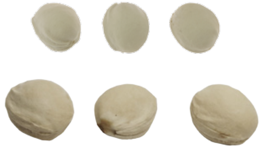
Imaxe 14: Ósos pequenos de cerdeira silvestre e de maior tamaño nunha variedade enxertada.