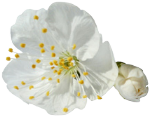
Imaxe 35: Flor do clon Prunus avium Lourizán-5.