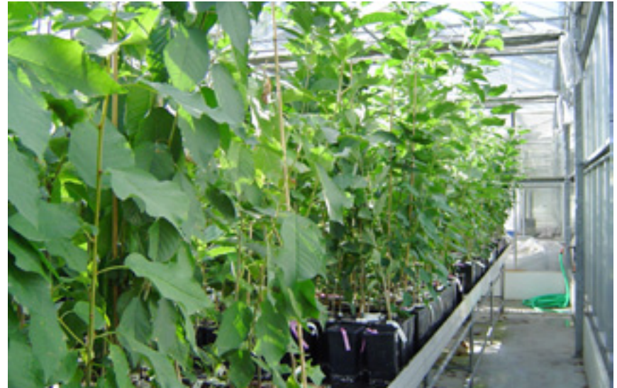
Imaxe 19: Ensaio de tolerancia á seca e ao asolagamento.