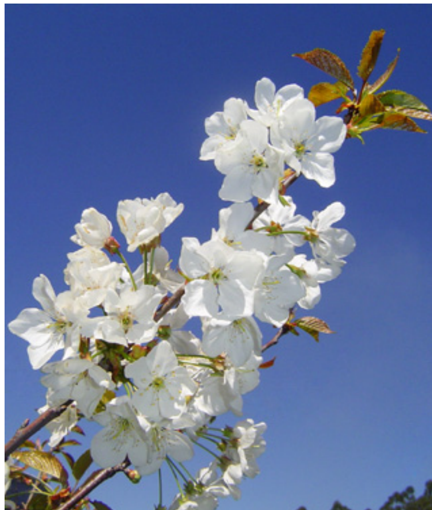
Imaxe 43: Rama dunha árbore de cerdeira durante a floración no mes de marzo.