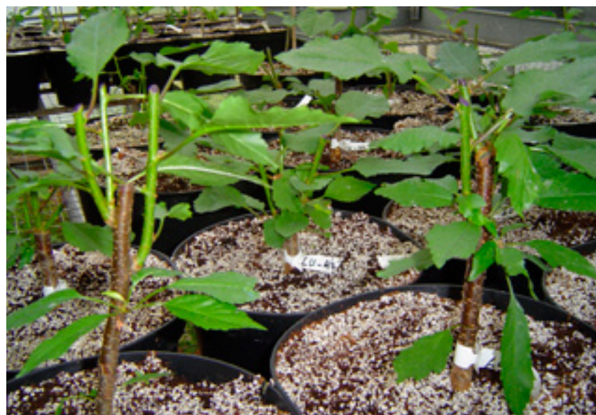
Imaxe 38: Plantas nai de cerdeira das que se obteñen os gallos semileñosos.

A base do gallo introdúcese no sal potásico do ácido indol 3-butírico (AIB-K), nunha concentración de 2 g·l -1 , durante cinco minutos. Antes da aplicación da auxina é recomendable introducir as bases nun