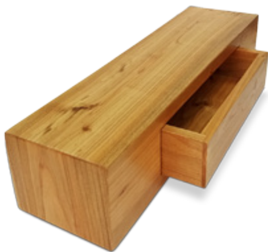
Imaxe 58: Estante feito con madeira de cerdeira por Jorge Vilas.