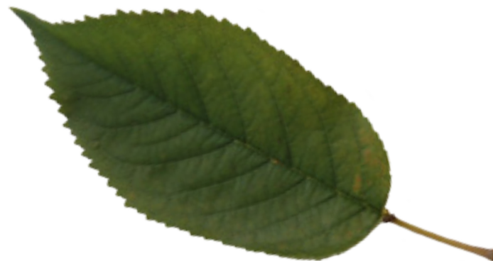
Imaxe 33: Folla do clon Prunus avium Lourizán-4.

A selección definitiva para a inclusión inicial no rexistro como material cualificado procede dos resultados obtidos aos catro anos de crecemento nunha plantación clonal experimental (Imaxe 31). Esta plantación inclúe plantas de doce clons seleccionados de dúas fontes de materiais: por unha banda, proceden da selección noutras plantacións experimentais establecidas e avaliadas en anos anteriores, e por outra, proceden de clons do banco clonal, mencionado previamente, con estrutura de familias situado no Centro de Investigación Forestal de Lourizán. As árbores da plantación están dispostas en 15 bloques, cun marco de plantación de 3 x 3 metros e cunha planta de cada un dos 12 clons situada ao azar en cada un dos