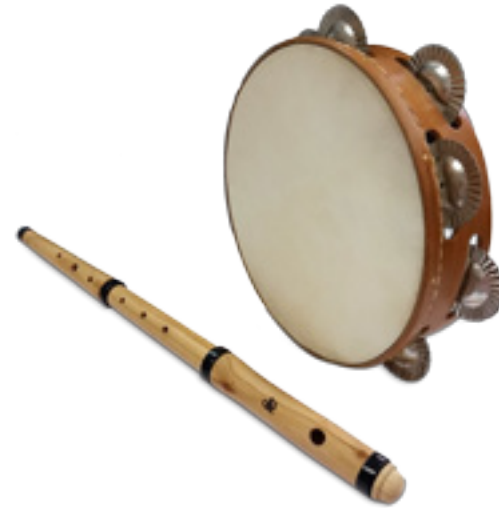
Imaxe 47: Pandeireta e requinta elaboradas por Sito Guimeráns con madeira de cerdeira.