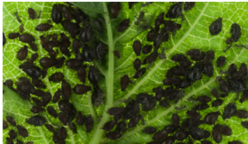
Imaxe 16: Pulgón no envés das follas.