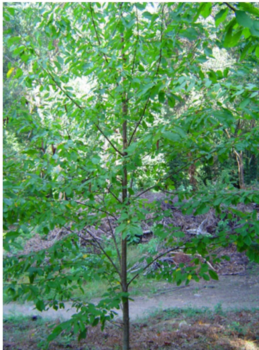
Imaxe 27: Árbore do clon Prunus avium Lourizán-2 nunha plantación clonal no Centro de Investigación Forestal de Lourizán.

Este clon estase multiplicando por cultivo in vitro . Na actualidade está sendo estudado en seis plantacións clonais establecidas dende 2004, onde se rexistran supervivencias superiores ao 90 % das árbores.