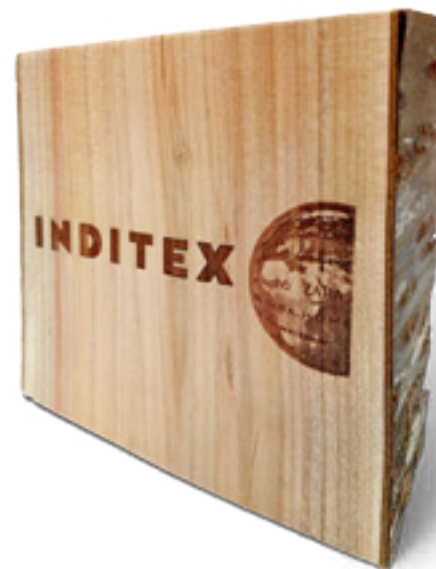
Imaxe 64: Peza de cerdeira cunha impresión con láser realizada por Ekipaje Personal.