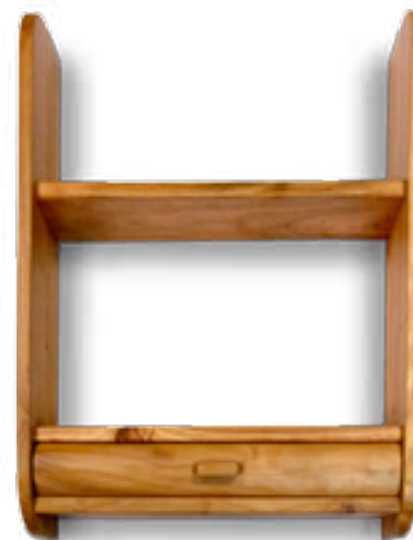
Imaxe 61: Andel realizado con madeira de cerdeira por Lores Lores C.B.