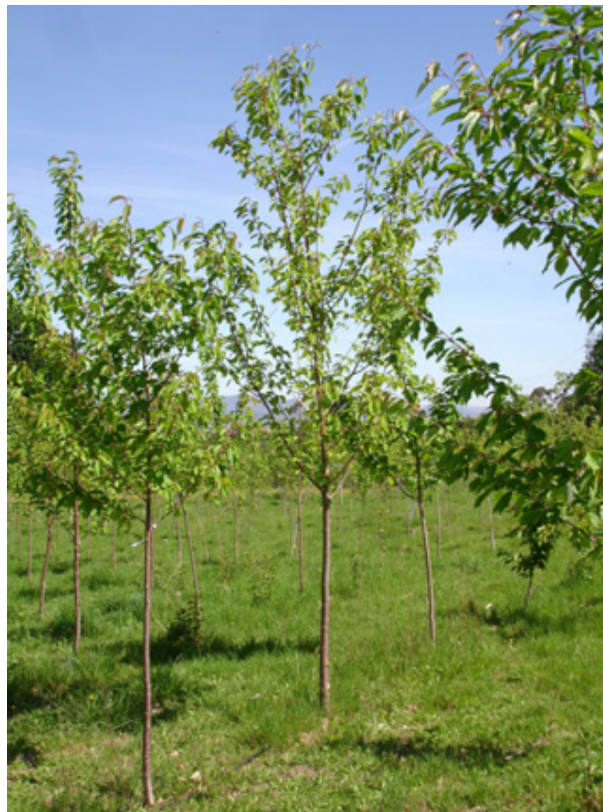
Imaxe 26: Árbore do clon Prunus avium Lourizán-1, situada no centro da imaxe e con maior tamaño, nunha plantación clonal no Centro de Investigación Forestal de Lourizán.

En canto ás características morfolóxicas das árbores, adoitan presentar fustes rectos sen bifurcacións na zona madeirable e con ramificación en verticilos. O número medio de ramas por debaixo dos 2,5 m é de nove, agrupadas en verticilos cunha media de 2,4 ramas. Este clon presenta como características distintivas unha flexibilidade nas ramas, que non se observa noutras árbores, e un aspecto alongado dos froitos e das sementes. A floración é tardía e ten lugar na segunda semana de abril.