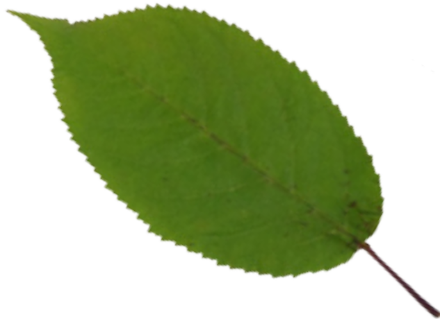
Imaxe 36: Folla do clon Prunus avium Lourizán-5.

Na plantación clonal posúe unha supervivencia do 100 %. A altura media aos catro anos é de 3,40 metros, mentres que o valor medio da plantación é de 2,75 metros e o do clon de referencia, Lourizán-1, de 2,40 metros. O diámetro normal medio, aos catro anos, é de 2,4 cm, sendo o valor medio da plantación de 1,9 cm e o do clon de referencia de 1,5 cm. O crecemento en altura aos catro anos supera nun 26 % o crecemento medio das árbores da plantación (Miranda-Fontaiña et al. , 2017a).