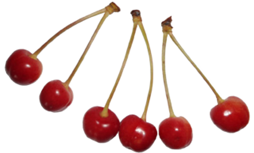
Imaxe 13: Froito de cerdeira silvestre.

Outra característica da especie é o comportamento reprodutivo, que pode cambiar segundo as características do ecosistema. De feito, a estratexia das cerdeiras silvestres é utilizar a propagación vexetativa por brotes de raíz cando o ecosistema está nas fases xuvenís, mentres que predomina a propagación por sementes cando o ecosistema é maduro. Por isto é posible atopar grupos formados por numerosas árbores en áreas abertas, cando se necesita unha rápida recolonización, e só unhas poucas árbores illadas por hectárea cando o ecosistema forestal está ben equilibrado e é maduro (Ducci et al. , 2013).