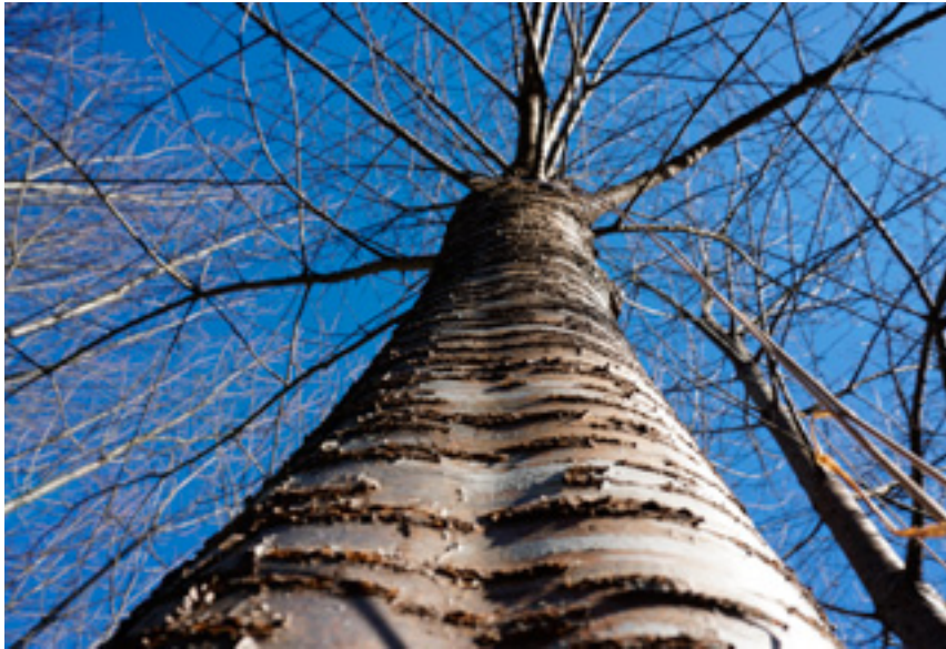
Imaxe 2: Tronco de cerdeira con costelas no couce.

As flores, reunidas en feixes cun mínimo de 2 a 3 flores, posúen un diámetro de 2 a 3,5 cm e a corola está formada por cinco pétalos brancos (Imaxe 7). O número de estames é superior a 30, estando situados a diferentes niveis (Imaxe 8). Nalgunhas árbores pódense observar estames convertidos en pétalos (Imaxe 9). As flores fórmanse nas xemas florais desenvolvidas no verán anterior. Estas xemas distínguense facilmente por ser máis arredondadas que as xemas vexetativas (Imaxes 10 e 11).