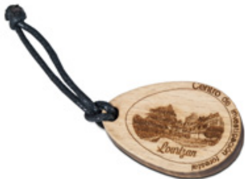
Imaxe 63: Peza de madeira de cedeira elaborada e gravada con láser por Ekipaje Personal na que se representa o pazo do Centro Forestal de Lourizán.