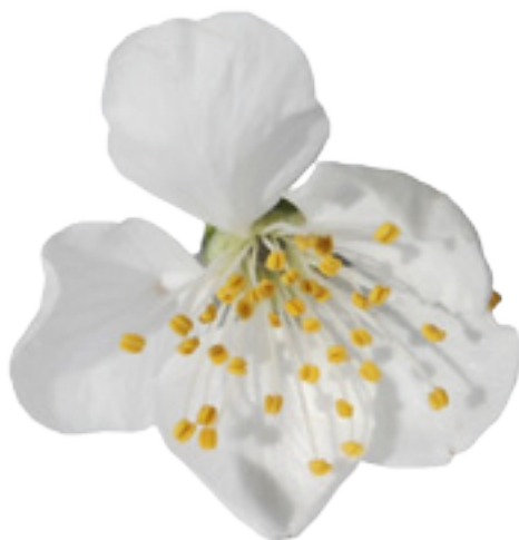
Imaxe 32: Flor do clon Prunus avium Lourizán-4.

Para comprobar o bo crecemento e forma foi preciso o establecemento de plantacións clonais comparativas, cun deseño en bloques completos ao azar, e para isto foi necesaria a multiplicación clonal previa por cultivo in vitro co fin de dispoñer de abundantes réplicas coetáneas das árbores seleccionadas.