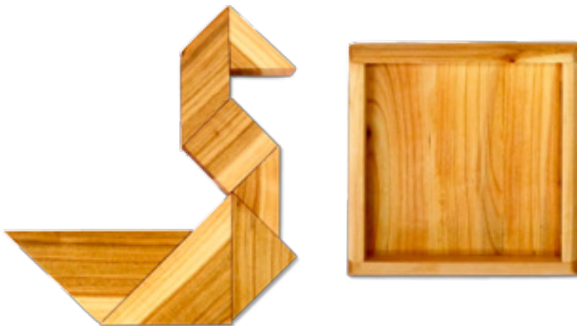
Imaxe 50: "Tangram" elaborado con madeira de cerdeira na sección de carpintería de Montecarrasco (Cangas) da Asociación Juan XXIII.