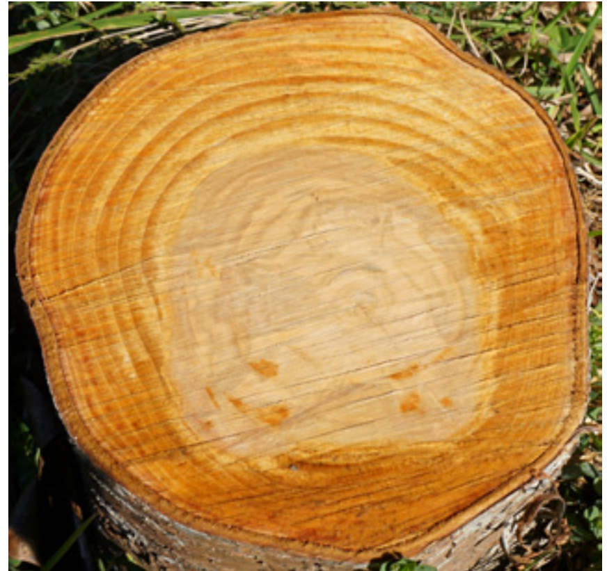
Imaxe 24: Aspecto da sección transversal dun tronco de cerdeira de 17 anos de idade.

Na actualidade existen parcelas clonais de experimentación, establecidas no marco de proxectos de selección e mellora, que se veñen avaliando dende hai máis dunha década no Centro de Investigación Forestal de Lourizán (Imaxes 22 e 23). Os criterios de avaliación e selección nas parcelas clonais son un conxunto de caracteres, sendo os principais o crecemento, a forma do tronco, o grosor das ramas, o tipo de ramificación, a resistencia á cilindrosporiose e a tolerancia á seca e ao asolagamento. Nestas parcelas obtivéronse resultados que permitiron seleccionar e rexistrar dous clons de orixe