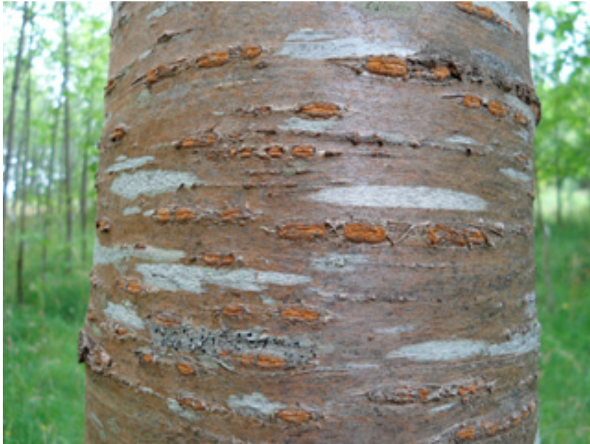
Imaxe 4: Casca dunha árbore de cerdeira.

nas árbores entre unha e tres semanas e a abundancia de flores tamén é moi variable (Miranda-Fontaíña e Fernández-López, 2008). Estes caracteres poden ser de utilidade dende o punto de vista ornamental (Imaxe 12). Na colección situadas no Centro de Investigación Forestal de Lourizán as flores comezan a abrir a principios de marzo nunha familia de árbores procedentes do sureste da provincia de Ourense, concretamente do Concello da Mezquita. Nas seguintes semanas dos meses de marzo e abril van abrindo as flores. A secuencia de floración repítase en anos sucesivos nas árbores de clons e nas familias da colección do Centro de Investigación Forestal de Lourizán.