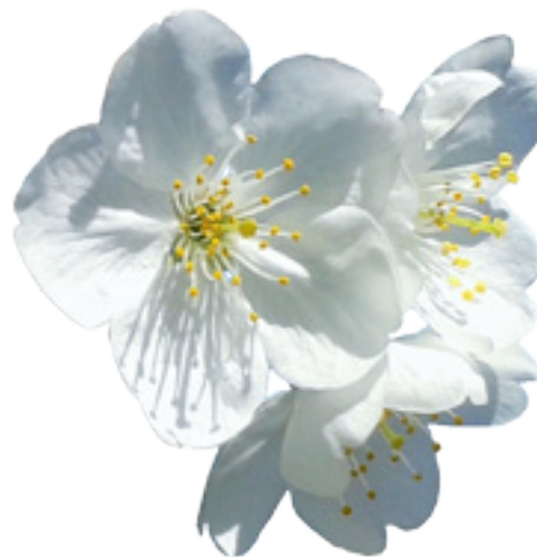
Imaxe 29: Flor do clon Prunus avium Lourizán-3.

As follas (Imaxe 30) son de cor verde media a escura e posúen forma elíptica con tendencia oval ou oboval. A base ten forma obtusa e o ápice é de lonxitude media a longa. O limbo ten unha lonxitude e anchura medias de 9,7 e 5,1 cm, respectivamente. Os bordos das follas posúen incisións pouco profundas e forma crinada e serrada. O pecíolo é lixeiramente pubescente e mide uns 3,9 cm. Nas follas desenvólvense estípulas de pequeno tamaño que caen co tempo.