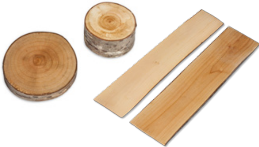
Imaxe 46: Aspecto da madeira de cerdeira en corte transversal e lonxitudinal do tronco.