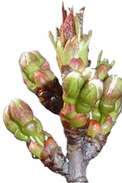
Imaxe 11: Xema floral de cerdeira con forma arredondada.