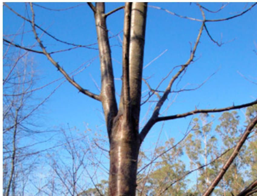
Imaxe 25: Rama grossa que compite co eixe principal da árbore.

Por todo isto, á hora de planificar unha plantación recoméndanse terreos de val e antigos terreos agrícolas.