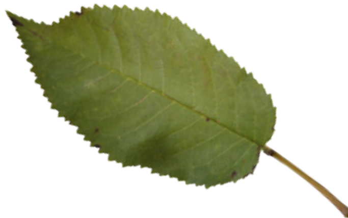
Imaxe 30: Folla do clon Prunus avium Lourizán-3.