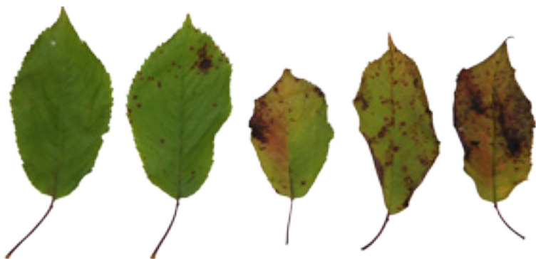
Imaxe 15: Follas de cerdeira con diferente grao de extensión das lesións producidas polo fungo Blumeriella jaapii , que ocasionan a doenza coñecida como cilindrosporiose.

Outra afección tamén frecuente é a gomose ( Pseudomonas sp. ), onde aparece como síntoma máis aparente un exsudado nas feridas do tronco (Imaxe 17). A sensibilidade a esta doenza varía entre familias de árbores.