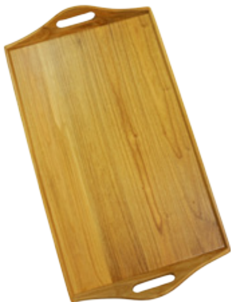
Imaxe 62: Bandexa elaborada con madeira de cerdeira por Lores Lores C.B.