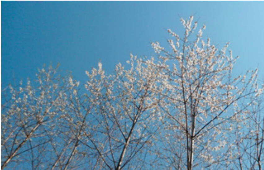
Imaxe 12: Cerdeiras durante a floración nos meses de marzo e abril.

Outra característica da especie é o comportamento reprodutivo, que pode cambiar segundo as características do ecosistema. De feito, a estratexia das cerdeiras silvestres é utilizar a propagación vexetativa por brotes de raíz cando o ecosistema está nas fases xuvenís, mentres que predomina a propagación por sementes cando o ecosistema é maduro. Por isto é posible atopar grupos formados por numerosas árbores en áreas abertas, cando se necesita unha rápida recolonización, e só unhas poucas árbores illadas por hectárea cando o ecosistema forestal está ben equilibrado e é maduro (Ducci et al. , 2013).