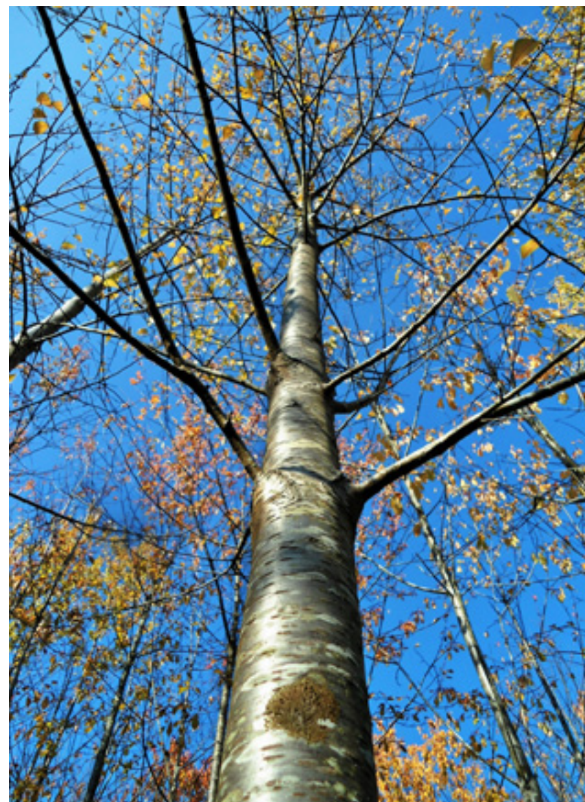
Imaxe 31: Árbore do clon Prunus avium Lourizán-4 no banco de clons aos dezanove anos.

As árbores do banco clonal foron avaliadas en diferentes ocasións e aos catorce anos preseleccionáronse as que presentaban mellor forma e crecemento, aínda que este último carácter tomouse con reservas ao carecer a parcela dun deseño adecuado en bloques ao azar.