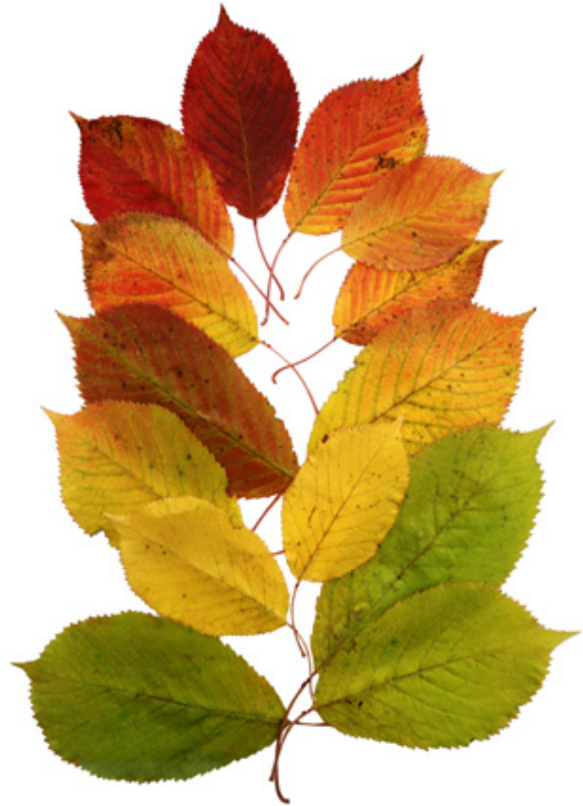
Imaxe 5: Variación na cor das follas dunha árbore de cerdeira durante o outono.

O proceso de polinización é desenvolvido principalmente por abellas e abellóns, que realizan un papel importante na dispersión xeográfica do pole, o que favorece o aumento da diversidade xenética nas poboacións (Breitbach et al. , 2010; Ducci et al. , 2013).