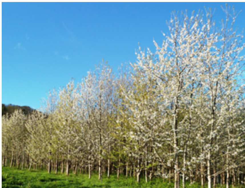
Imaxe 42: Plantación de cerdeira durante a floración no Centro de Investigación Forestal de Lourizán.

As liñas de selección desenvolvidas no Centro de Investigación Forestal de Lourizán achegan un amplo grupo de material autóctono con características diversas. Na colección de árbores de orixe galega, ademais dos materiais con destino forestal, hai outros con características diversas que poden ter outros usos. As árbores están caracterizadas por crecemento, forma e fenoloxía da brotación, floración e caída de folla.