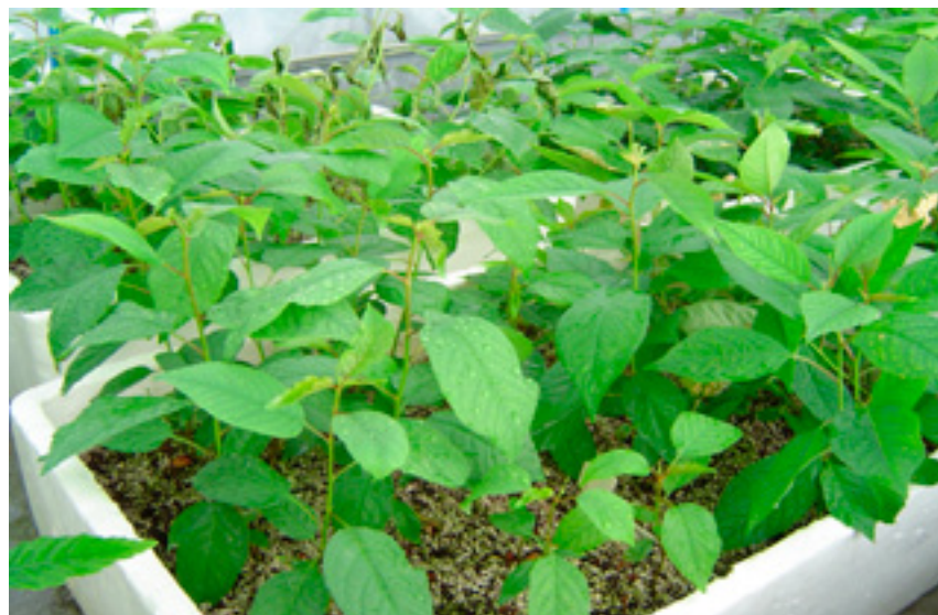
Imaxe 41: Plantas de cerdeira procedentes de cultivo in vitro durante a etapa de aclimatación no invernadoiro.

As plantas son transplantadas a testos de 2 litros de capacidade, cun substrato formado por turba e perlita ao que se lle engade Osmocot®. Desenvólvense nun invernadoiro e aplícanse regas frecuentes.