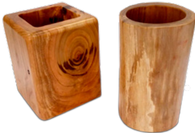
Imaxe 55: Portalapis realizados con madeira de cerdeira por Jorge Vilas.