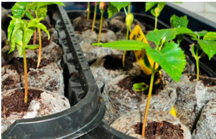
Imaxe 21: Plantas de sementes procedentes de polinizacións controladas.

Todos estes caracteres permiten seleccionar as árbores adecuadas para cada clima e solo de Galicia. Posteriormente as árbores son certificadas.