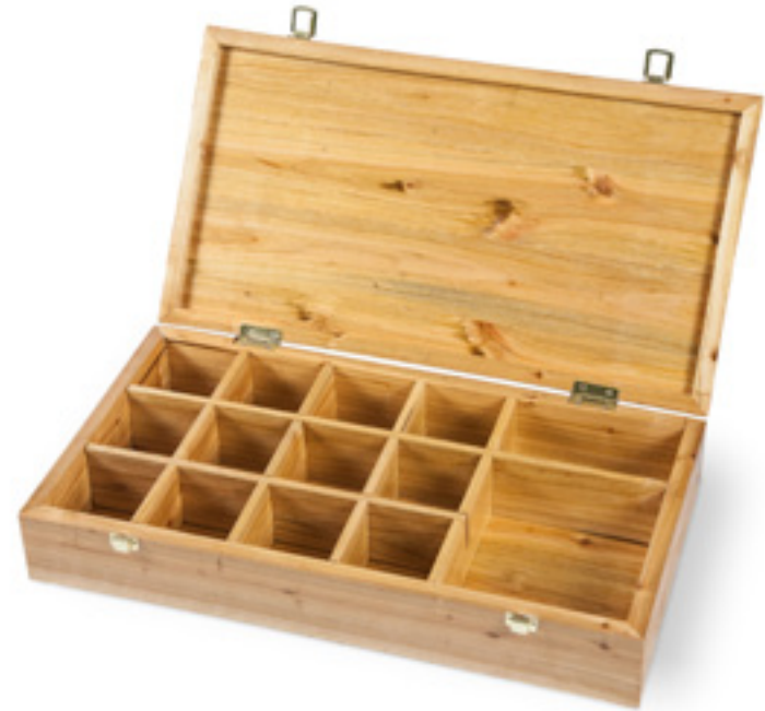
Imaxe 56: Caixa feita con madeira de cerdeira por Jorge Vilas.