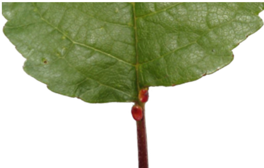
Imaxe 6: Nectarios na base do limbo e no pecíolo das follas.