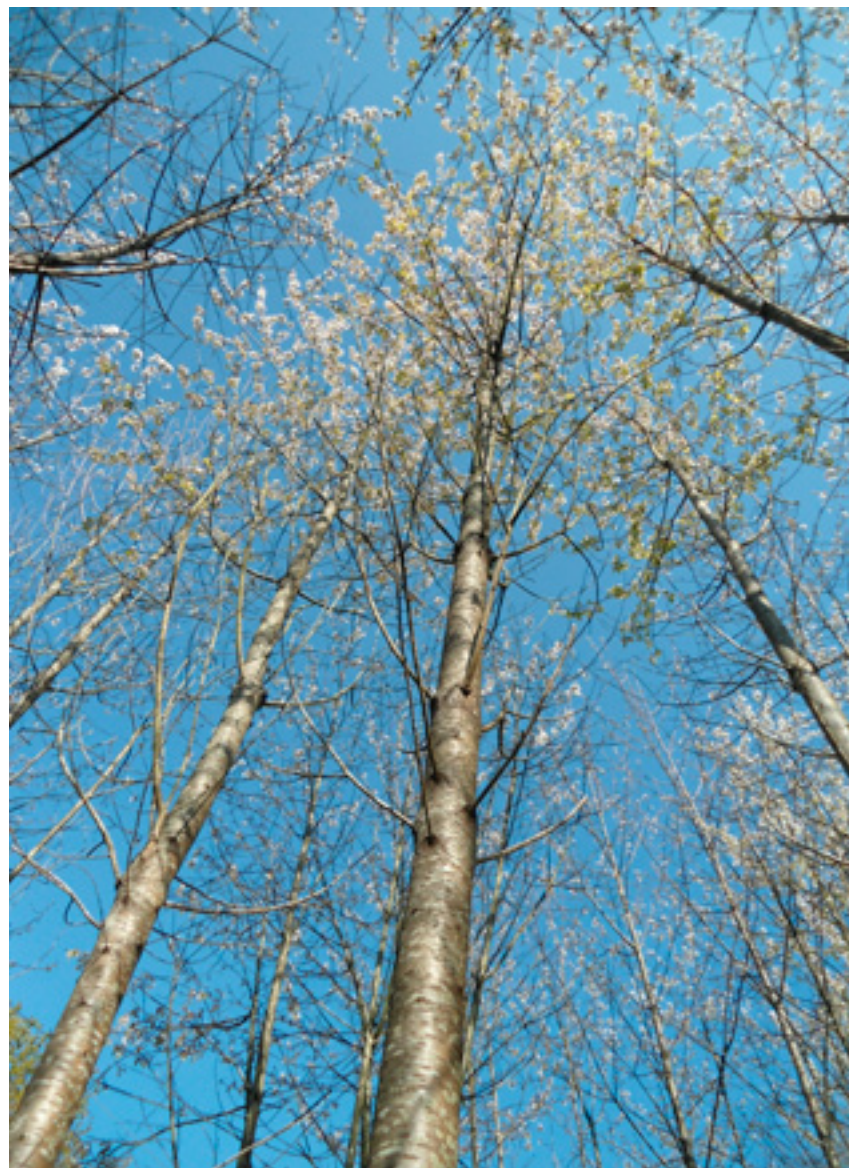
Imaxe 28: Árbore do clon Prunus avium Lourizán-3 no banco de clons aos dezanove anos.

O clon Lourizán-3 estase a multiplicar por cultivo in vitro (Miranda-Fontaiña e Fernández-López, 2015), con taxas de multiplicación moi elevadas, unha porcentaxe de enraizamento do 100 % e porcentaxes de aclimatación superiores ao 90 %. As árbores resultantes están sendo avaliadas na actualidade en cinco plantacións clonais, a primeira delas establecida en marzo do ano 2013.