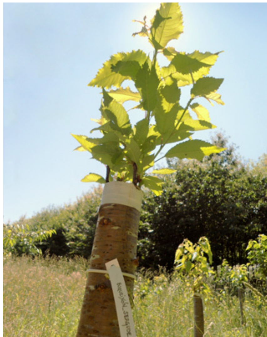
Imaxe 37: Enxerto de pugas de árbores seleccionadas adultas sobre portaenxertos xuvenís.

A reprodución por gallos semiherbáceos desenvólvese no Centro de Investigación Forestal de Lourizán dende 1997 con bos resultados. Neste proceso distínguense varios factores que poden condicionar os resultados: as características das plantas nai e os gallos obtidos delas, o emprego de reguladores de crecemento e funxicidas, o substrato de enraizamento e a fertilización e as condicións ambientais das instalacións durante o enraizamento.