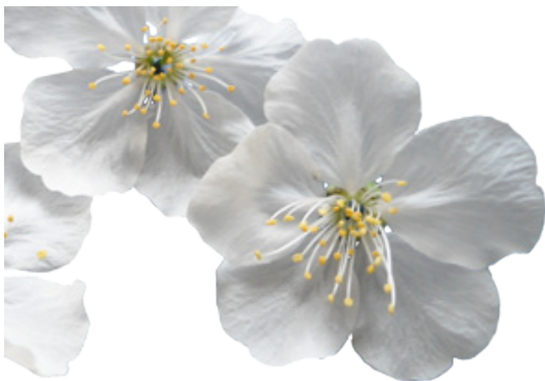
Imaxe 7: Flores de cerdeira.