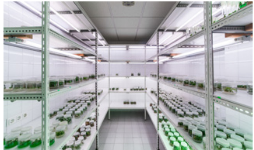
Imaxe 20: Cámara de crecemento no laboratorio de micropropagación, cunha colección de parte dos clons de cerdeira crecendo en condicións ambientais controladas e libres de patóxenos.