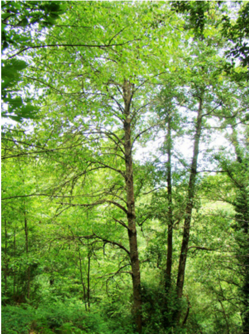
Imaxe 18: Árbore superior de cerdeira.