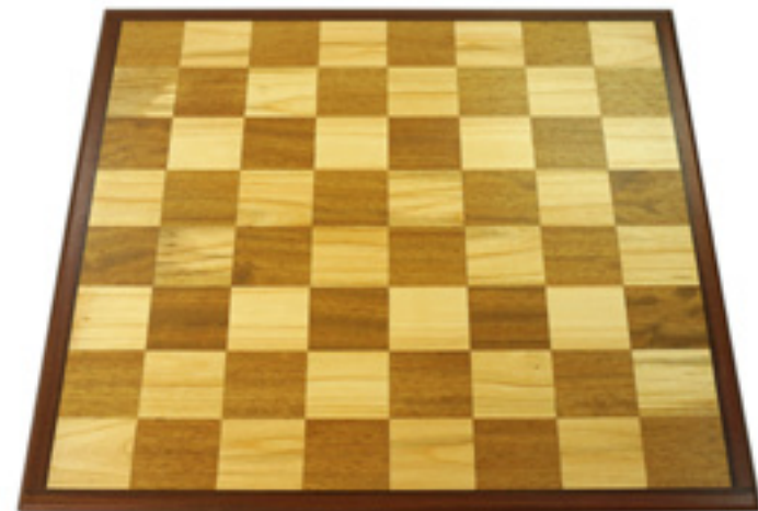
Imaxe 52: Taboleiro de xadrez feito con madeira de cerdeira (casas claras), de iroco (casas escuras) e de ipé (bordo) na sección de carpintería de Montecarrasco (Cangas) da Asociación Juan XXIII.