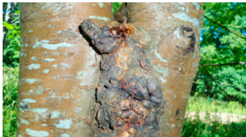
Imaxe 17: Gomose na casca.