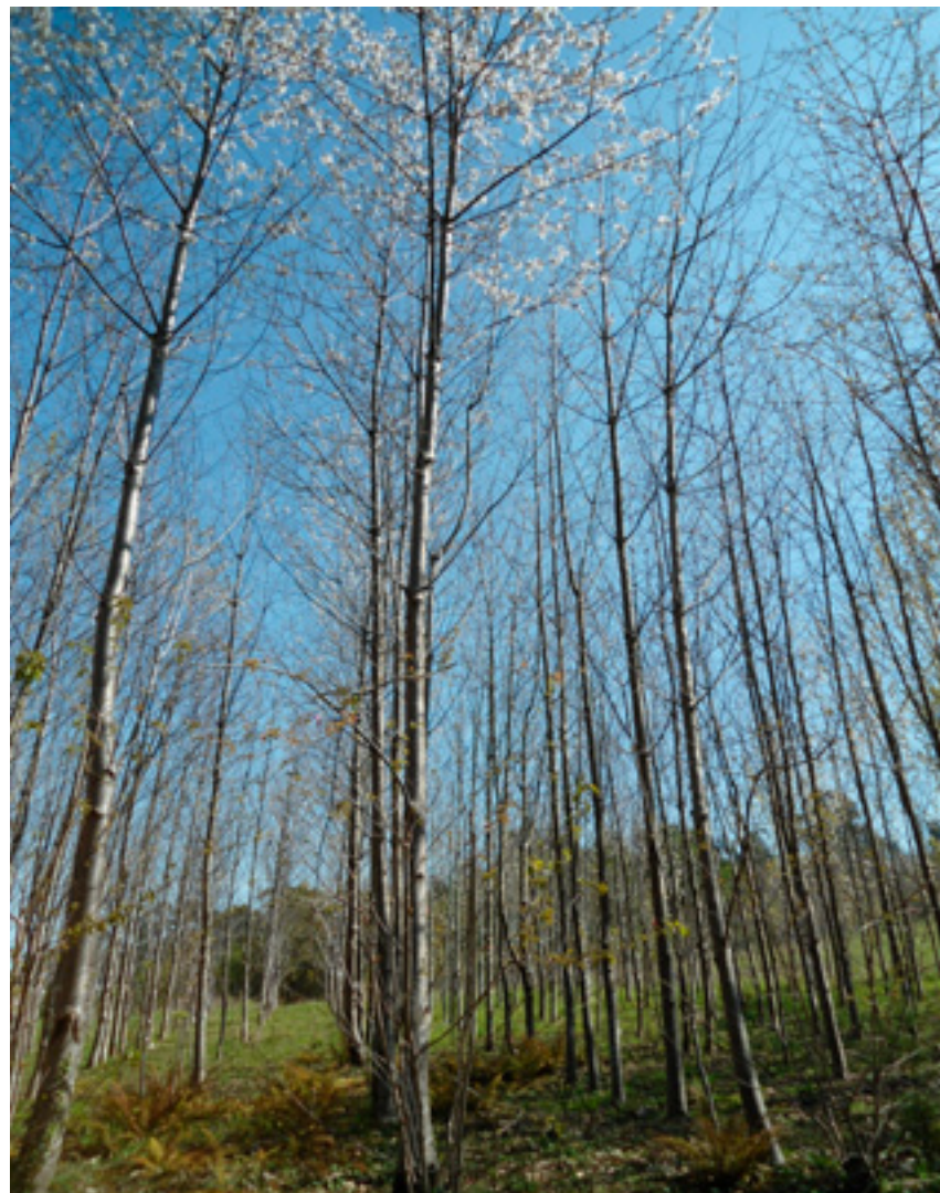
Imaxe 1: Plantación de árbores seleccionadas de cerdeira no Centro de Investigación Forestal de Lourizán.

Na maioría das árbores a floración ten lugar antes de que as follas agromen. Na colección só nas árbores dunha familia orixinaria da provincia de Lugo a brotación e a floración acontecen ao mesmo tempo (Miranda-Fontaiña e Fernández-López, 2008).