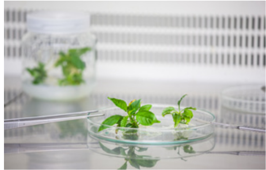
Imaxe 40: Plantas de cerdeira obtidas por cultivo in vitro .

Os brotes de máis de 3 cm desenvolvidos durante a etapa de multiplicación son illados e colocados, durante 10 días, en medio de cultivo Murashige e Skoog (1962) coa concentración de nitratos reducida á metade e con 0,5 \text{ mg.l}^{-1} de AIB. Transcorrido este período