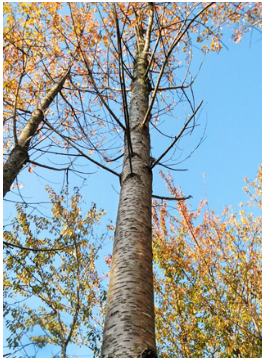
Imaxe 34: Árbore do clon Prunus avium Lourizán-5 no banco de clons aos dezanove anos.

O crecemento no banco clonal aos catorce anos é de 13,4 m de altura e de 11 cm de diámetro normal e aos dezanove anos é de 17 m de altura (Miranda-Fontaiña et al. , 2017a).