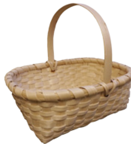
Imaxe 45: Cesta elaborada por Enrique Táboas a partir de láminas de madeira de cerdeira.