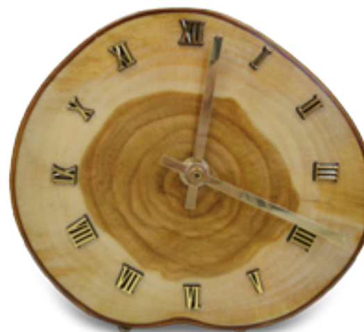
Imaxe 53: Reloxo elaborado con madeira de cerdeira.