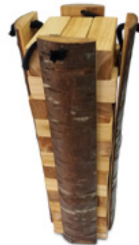
Imaxe 51: "Jenga" feita con madeira de cerdeira na sección de carpintería de Montecarrasco (Cangas) da Asociación Juan XXIII.