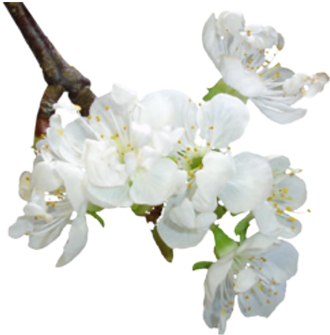
Imaxe 9: Flor de cerdeira con estames convertidos en pequenos pétalos.