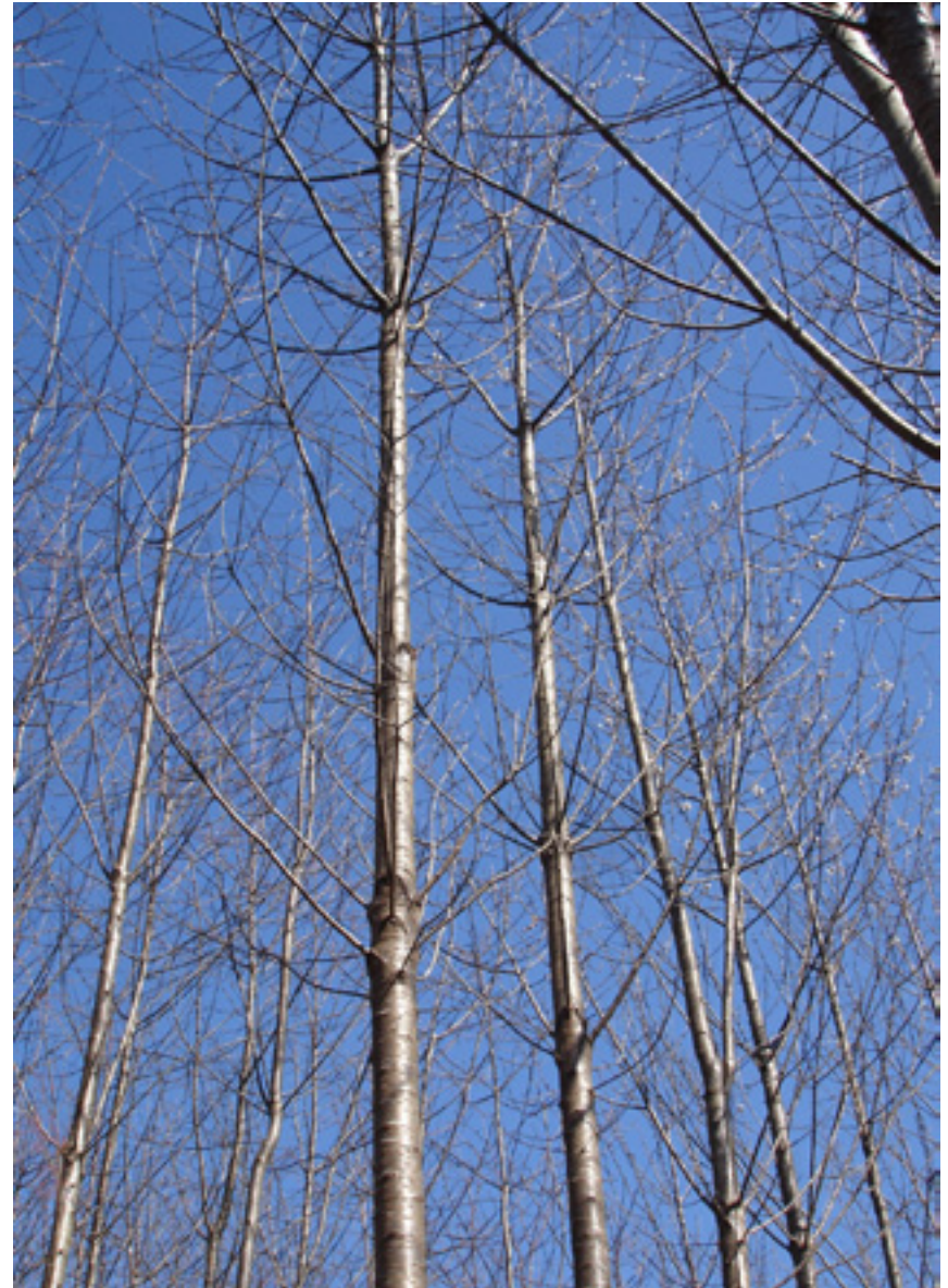
Imaxe 3: Árbores con ramas dispostas en verticilos.

O comezo da floración e o da brotación das follas están relacionados coa orixe xeográfica, como signo de adaptación ao clima máis ou menos frío ou temperán no que se desenvolveron as poboacións orixinais; así, as árbores e poboacións procedentes do sur da provincia de Ourense, con clima máis cálido, presentan xeralmente brotación máis temperá que as de Lugo e as de Asturias (Miranda-Fontaiña e Fernández-López, 2008). A duración da floración varía